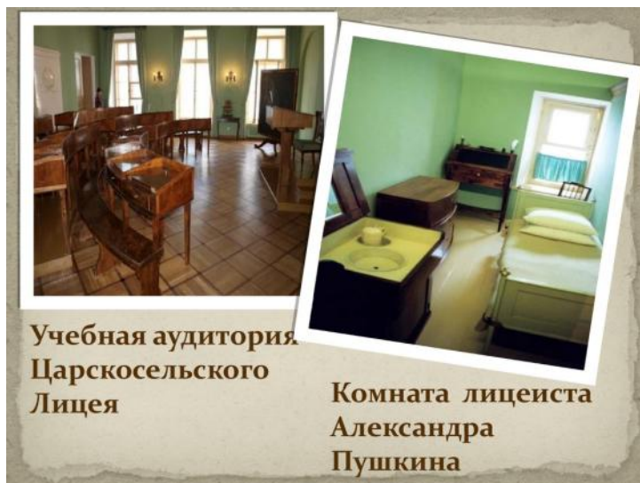
Учебная аудитория Царскосельского Лицея